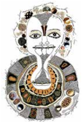
«Песочная речь» 2009