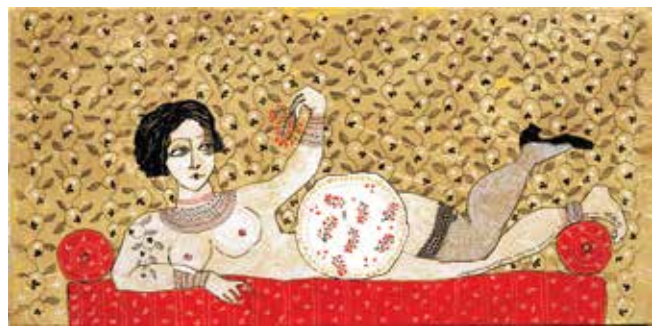
«Мультикультурное поедание красной смородины» 2011

Холст, акрил, тушь, золотая поталь, золотой объемный контур, аппликация, 60×45 см