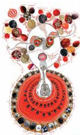
«Арбузная голова» 2009