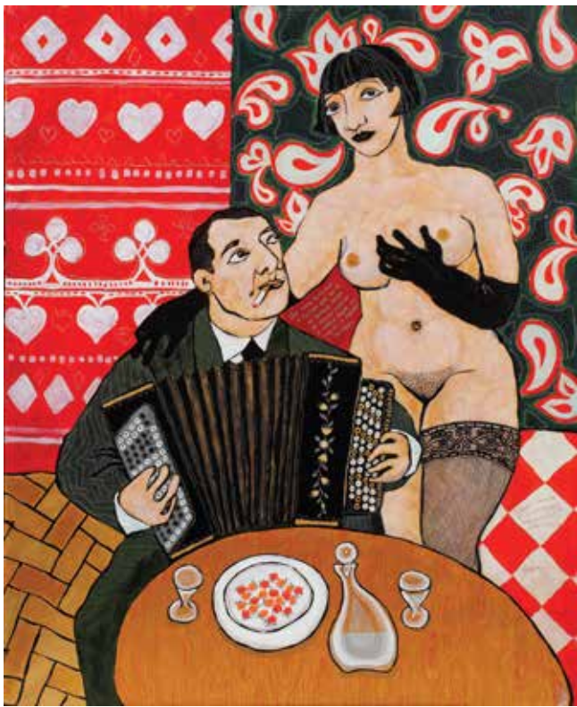
«Два поэта выступают в русском кафе...» 2014