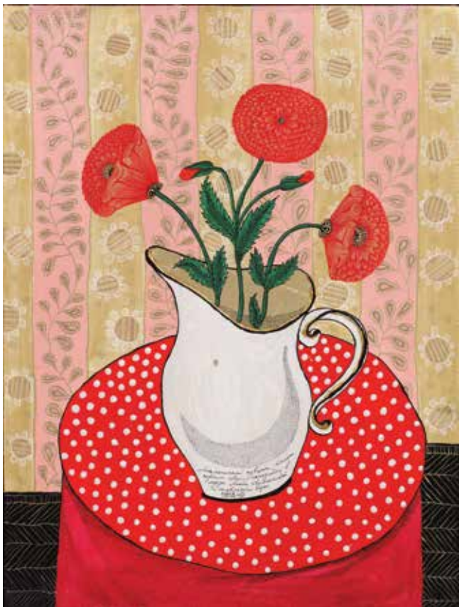
«Аналогичный кувшин...» 2009

Холст, акрил, тушь, золотая поталь, золотой объемный контур, аппликация, 60×45 см