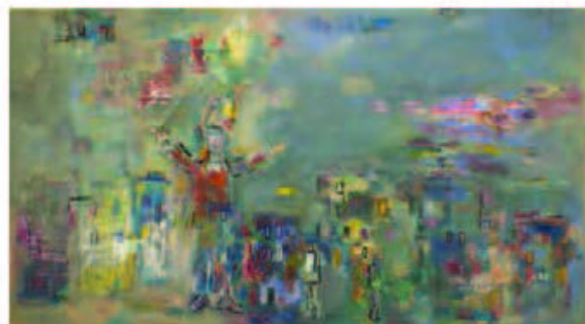
Клоун Холст, масло 100x180. 2015