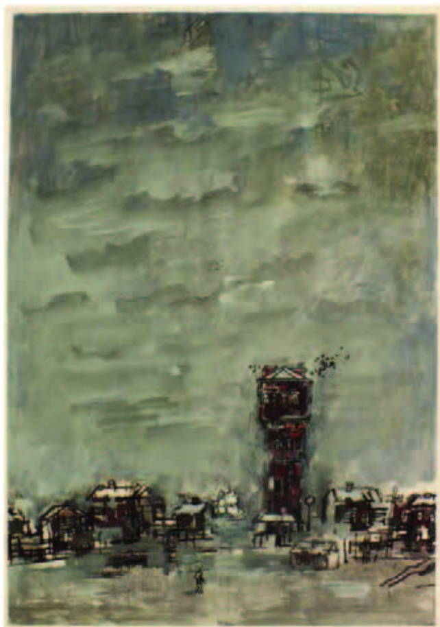
Зима. Парусник Бумага, смешанная техника 42x295. 2014