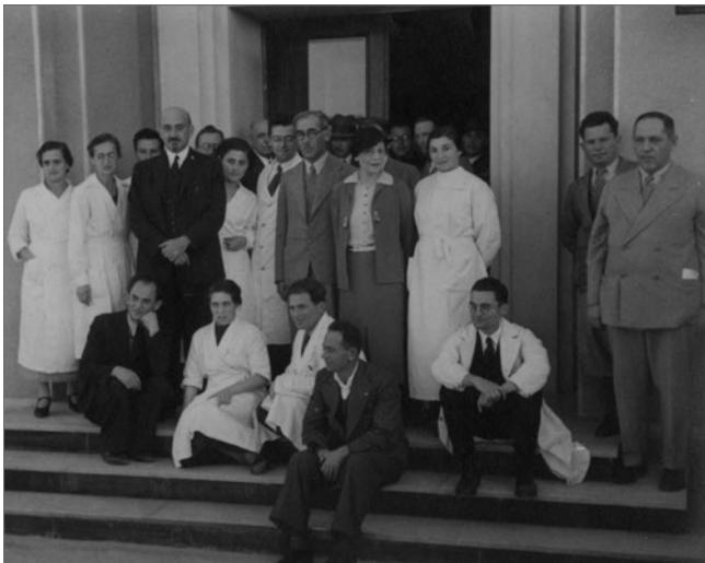
Первые сотрудники Научно-исследовательского института имени Даниэля Зива, на базе которого был основан Институт им. Вейцмана. Реховот, 1935 год