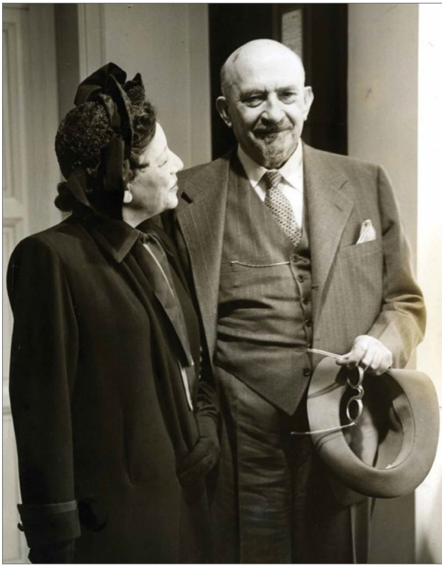
С супругой Верой Вейцман по пути из Нью-Йорка в Вашингтон, на встречу с президентом Гарри Трумэном, май 1948 года