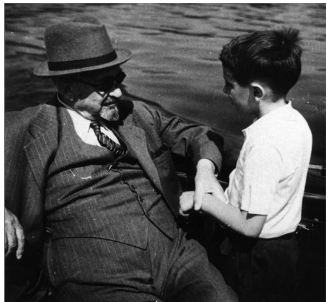
Хаïм Вейцман с внуком Давидом на Женевском озере, 1948 год