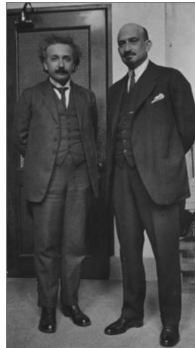
Хаïм Вейцман и Альберт Эйнштейн, США, 10 апреля 1921 года