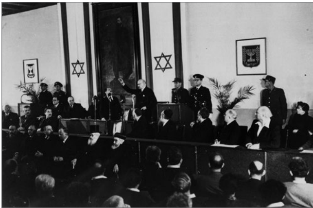
Церемония инаугурации президента Израиля Хаïма Вейцмана в израильском парламенте (кнессете), 17 февраля 1949 года