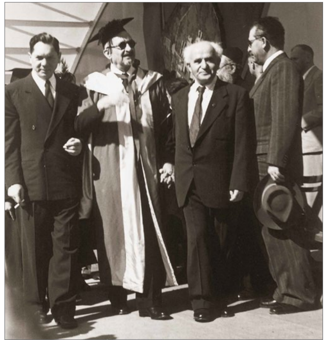
Хаïм Вейцман и премьер-министр Израиля Давид Бен-Гурион на торжественном открытии Института им. Вейцмана в Реховоте, 2 ноября 1949 года