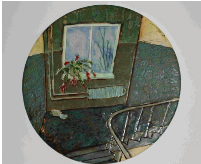
«Бутылки на окне»